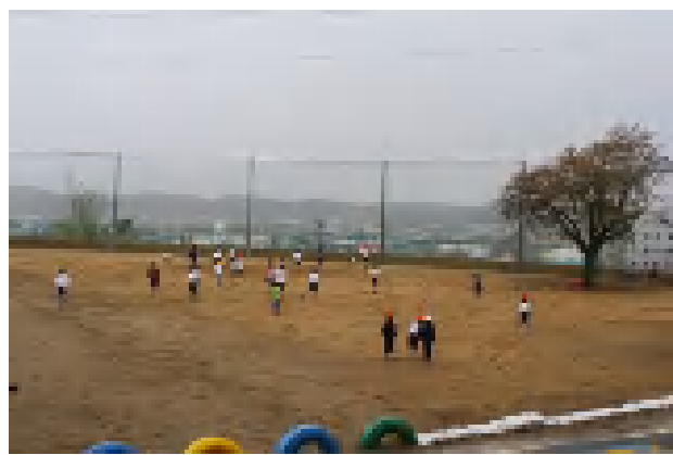
復興成った運動場で走り回って遊ぶ児童達。(於：鉾田小運動場 H24.4.23)

グラウンドに目を向ければ、まだ仮設の電柱は残っていますが、擁壁の斜面際に高さ5mのネットが貼られ、その外側には、金属製のネットフェンスが設けられ安全面も確保されています。